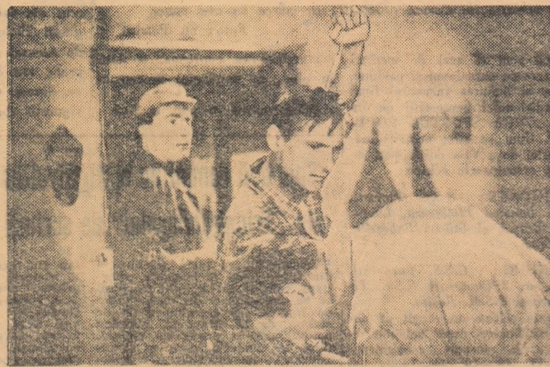
O producție a studioului cinematografic „București“

Scenariul: Nicolae Tîc, Radu Coșasu, Gabriel Barta. Imaginea: George Cornea. Muzica: Pascal Bentoiu. Regia: Mihai Bucur, Gabriel Barta