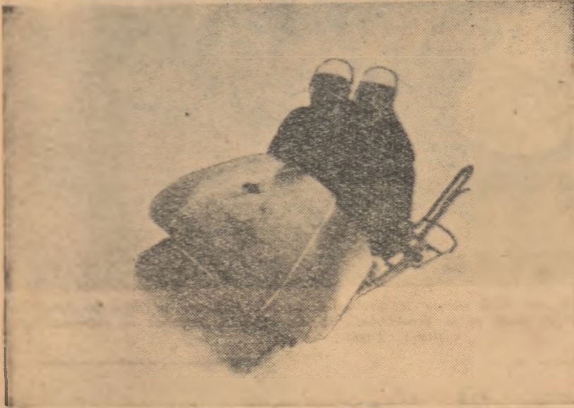
Chinajul de bob 2 persoane Ene-Paşovschi în plină cursă.