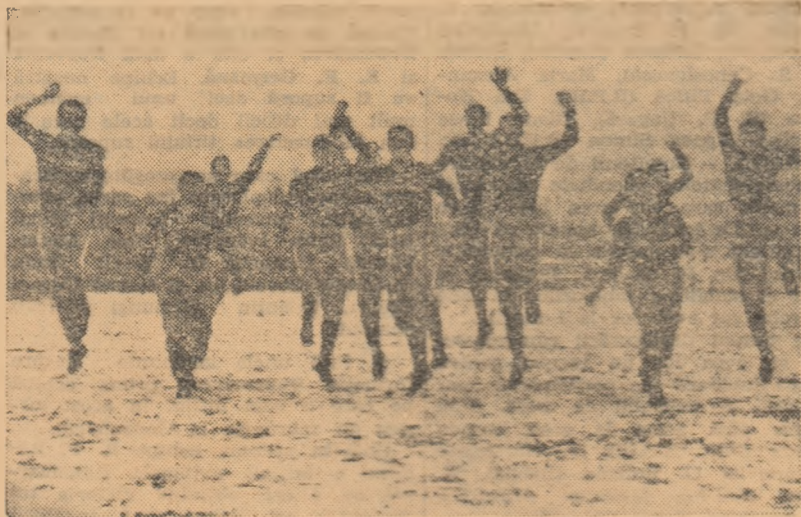
La un antrenament al juniorilor noștri, înainte de plecarea la Viareggio.

Primul meci al juniorilor noștri, care joacă sub numele de Progresul București, este programat sâmbătă, la ora 18.00, împotriva echipei din