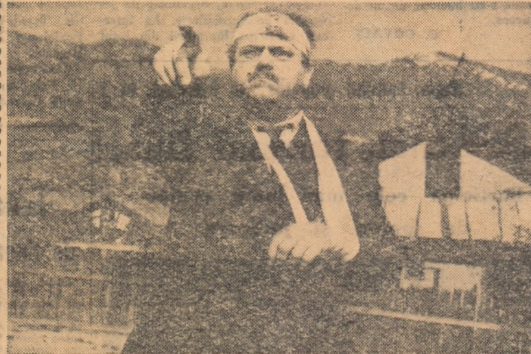
O producție a studioului cinematografic „București“

Scenariul: Nicolae Tîc, Eugen Mandric, Mircea Drăgan. Imaginea: Aurel Samson. Muzica: Theodor Grigoriu. Regia: Mircea Drăgan. Decoruri: Arh. Liviu Popa