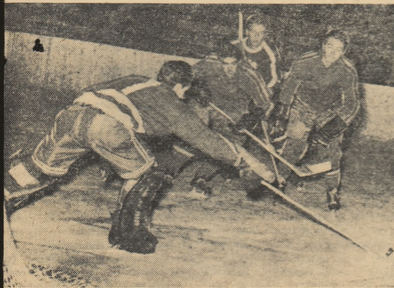
Un atac al jucătorilor noștri la poarta oaspeților.