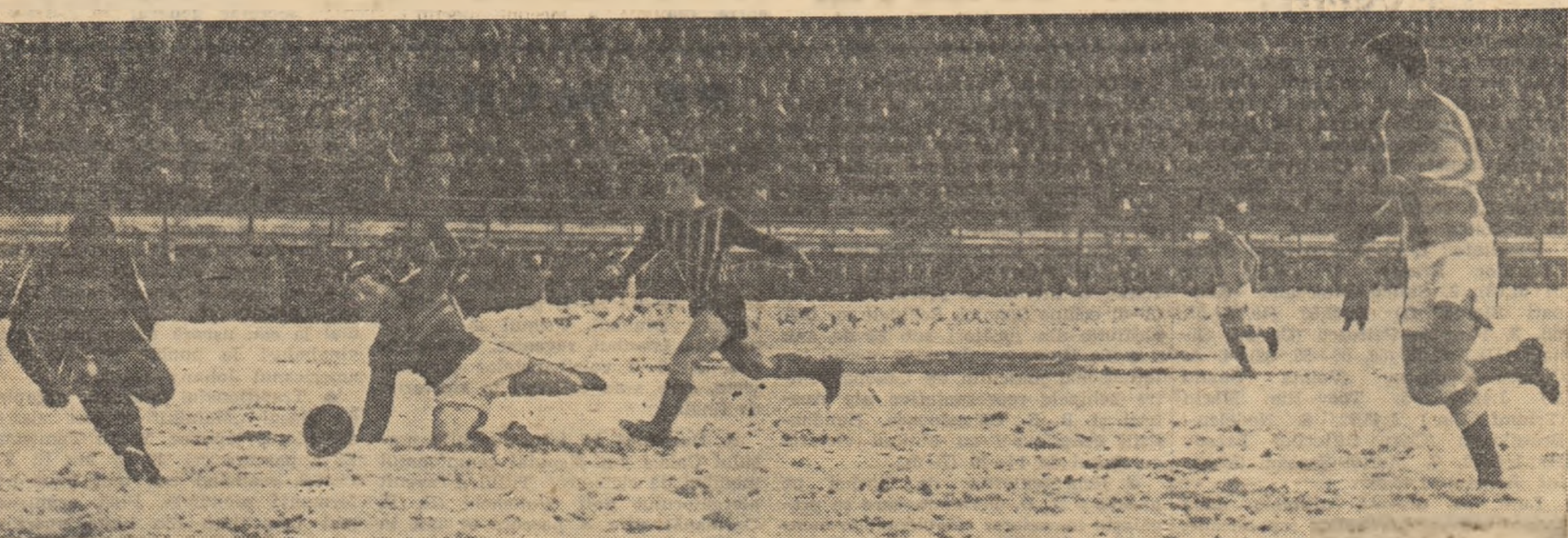
Terenul greu, acoperit cu zăpadă a solicitat ambelor formații eforturi deosebite. În fotografie o fază la poarta echipei Farul.