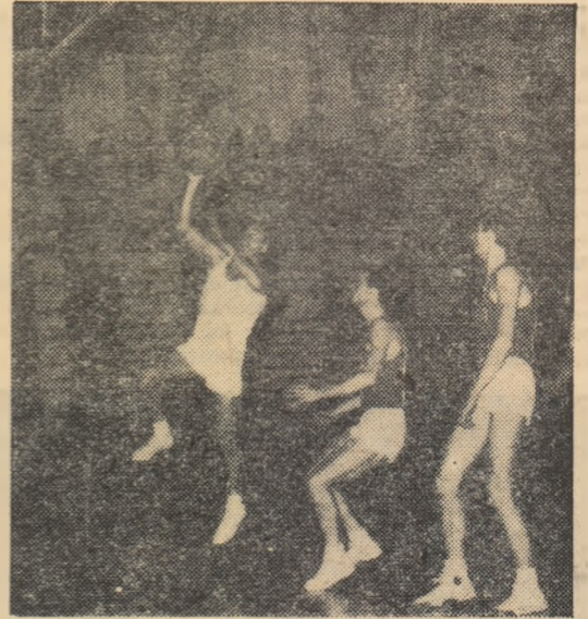
Unul din rarele momente cînd Steaua a găsit descoperită întreaga apărare a Științei. Nedef nu are lîngă el nici un adversar și va marca fără dificultate. Fază din jocul Știința — Steaua.

Studenții se impun de la început: 10-4 (min. 4) și 20-13 (min. 9), dar