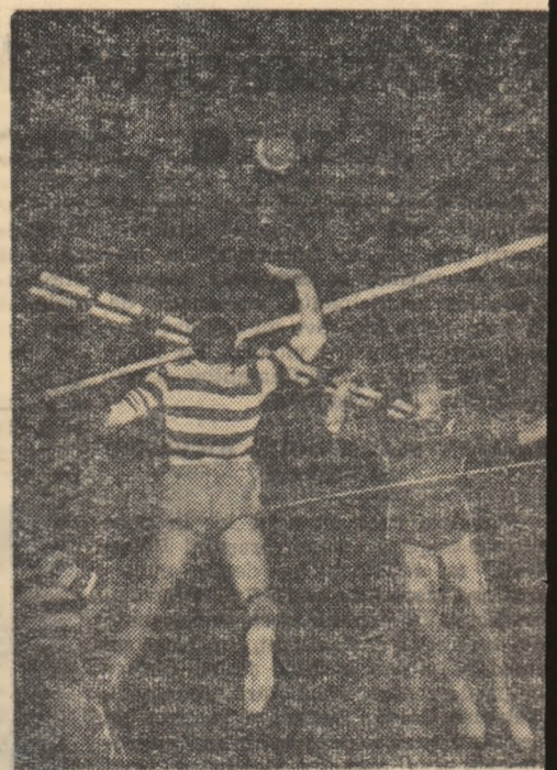
Unul din numeroasele dacluri la fileu oferite partida Steaua — Progresul

După acest meci a avut loc festivitatea de premiere a primelor echipe la juniori și junioare.