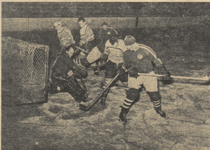
Un atac al hocheiștilor sovietici la poarta celor cehoslovaci. (Fază din meciul Lokomotiv — V.T.Z., 5-1)