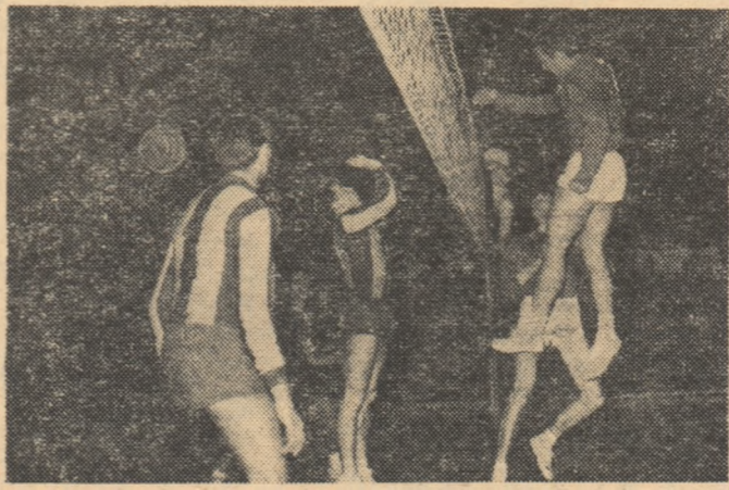
Atac rapidist reușit. A finalizat Plocon, utilizând o pasă în urcare, servită de Mincev

primii cinci. Iar dintre cei șase folosiți de Galatasaray (İşlay Yavuz, Önder Erdal, Sarızosen Yalçın, Bazlar Halidun, Demirtaş Güngör, Haznedaroglu Semih) cel mai eficient a fost primul patru.