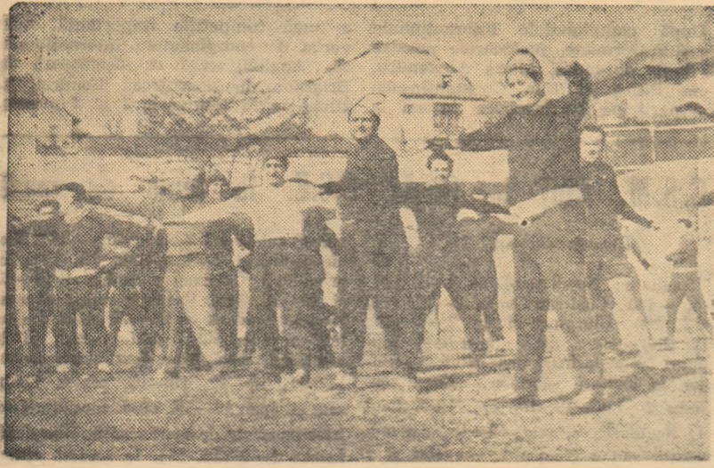
In cadrul pregătirilor pentru noul sezon arbitrii bucureșteni au în program și antrenamente în aer liber jatați la lucru într-una din sălile de pregătire în incinta salodromului Dinamo.