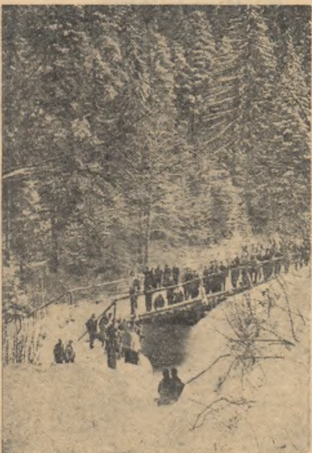
Sub brazi colili șerpuieste pirta de bob pe care s-au întrecut, săptămîna trecută, cei mai buni boberi ai țării. Iar printre spectatori nu s-au aflat numai pasionații acestui sport, ci și numeroși oaspeți ai Poeni, sosiți de pe meleagurile patriei și din alte țări la odihnă.