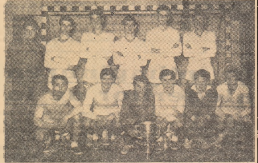
Echipa CLUJULUI SPORTIV ȘCOLAR, cîștigătoare pentru a patra oară con-secutiv a „CUPEI SPORTUL POPULAR” la juniori

Aceste aprecieri, ca și altele do-vedesc din plin valoarea ridicată a ediției de anul acesta a Cupei, pre-cum și bogăția cadrelor handbalului nostru în 7, rod al unei munci entu-ziasme și consecvente a profesorilor și antrenorilor.