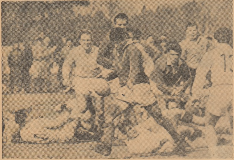
Cît de disputată a fost finala „Cupei 6 Martie” o dovedește și această imagine surprinsă de fotoreporterul nostru, V. Bageac...

Rugbiștii de la Dinamo au acționat spectaculos, dezvoltând numeroase șarje, dintre care o parte finalizate. Scorul a fost deschis de Giugiuc care a „culcat” balonul în terenul de țintă advers, în urma unei „bilbieli”