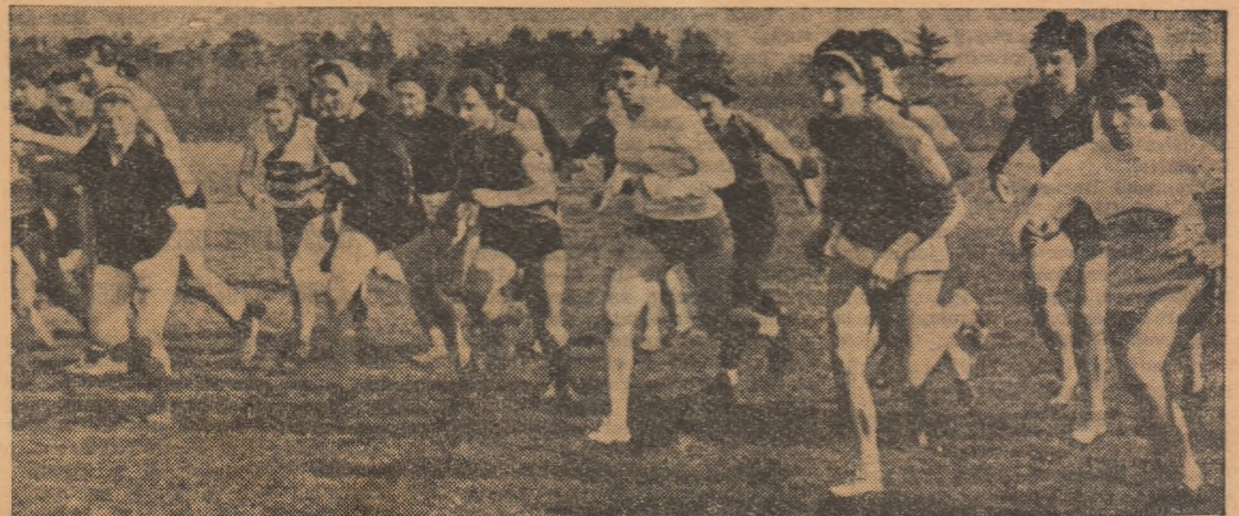
Plecarea în crosul senioarelor