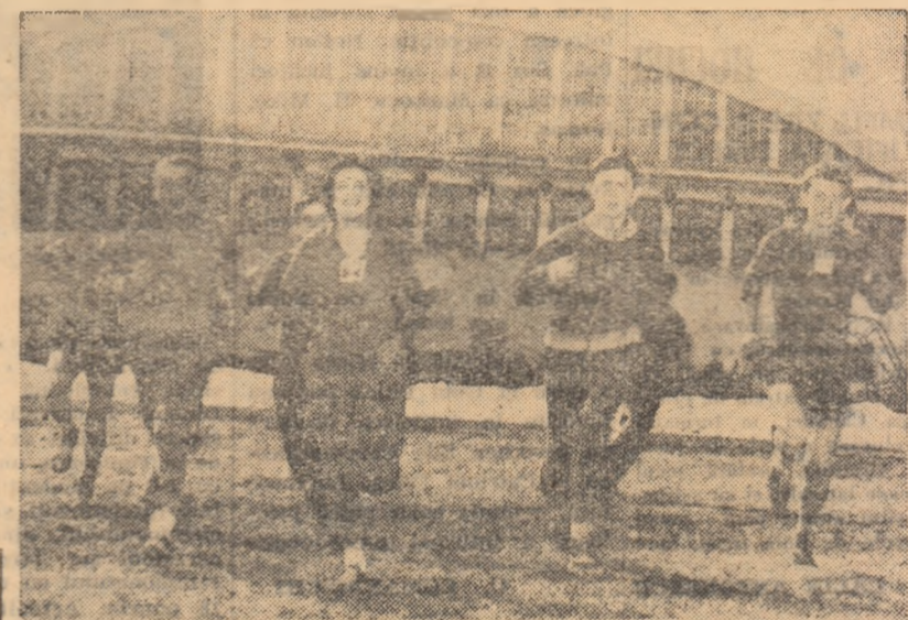
Un grup de copii din raionul Grivița Roșie făcînd încălzirea în aer liber.