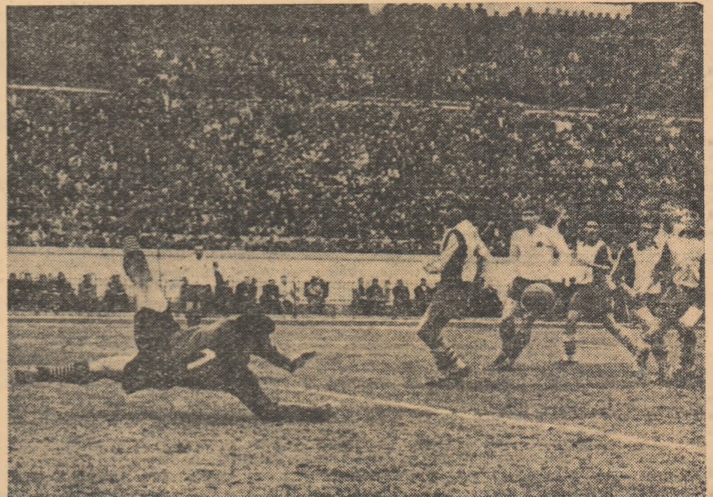
Un buchet de jucători urmărește balonul pe care-l va reține portarul ploieștean. Fază din jocul Steaua—Petrolul 3—1

În restanțele de ieri: Dinamo Buc.—Știința Timișoara 1-0 și Steaua—Petrolul Ploiești 3-1