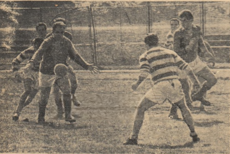
Fază din meciul Progresul — CSMS Iași