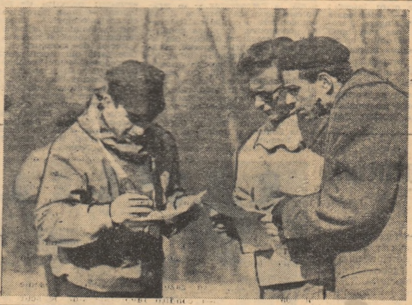
Duminică dimineața, în pădurea Băneasa 25 de echipe de orientare turistică, reprezentînd cluburile Flacăra (raionul 30 Decembrie), Gloria (1 Mai) și Știința, s-au întrecut în faza a III-a a Spartachiadei.