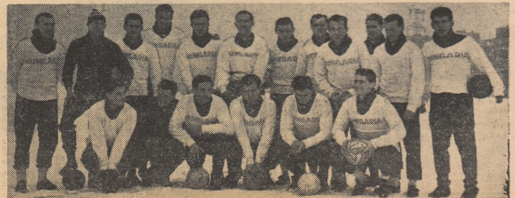
Lotul echipei olimpice a R.P. Ungare, care evoluează mîine în Capitală

DOPINGUL — „CANCERUL” SPORTULUI PROFESIONIST