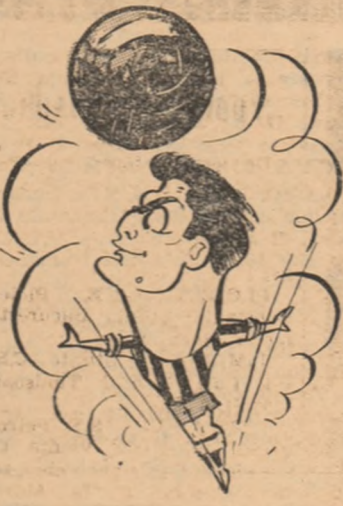
GREAVU (Rapid) văzuți de Neagu Rădulescu

gresul cu 4-0 iar feroviarul a realizat o excelentă performanță, miercuri, în fața selecționatului olimpic a R.P. Ungare. Ploieștenii vor menține formația de duminică, în timp ce antrenorii rapidiști nu s-au decis asupra celor doi interii, posturi pentru care au de ales între Georgescu, Balint, Ozon și Dinu.