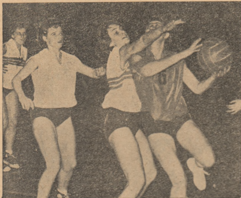
Fază din meciul Unirea — Știința București