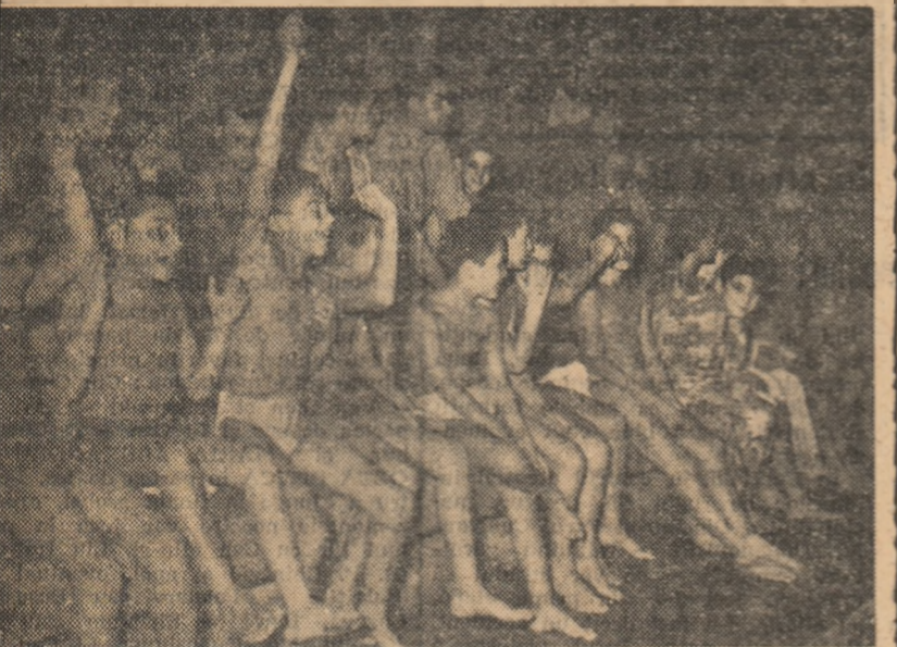
Galeria „bucureșteană” la concursul Școlilor sportive de elevi, desfășurat anul trecut

Iată programul celor două zile de concurs: ASTĂZI , de la ora 18: 100 m spate fete, 100 m bras băieți, 33 m liber fete, 33 m spate băieți, 33 m fluture fete, 66 m liber băieți, 66 m bras fete, 66 m fluture băieți.