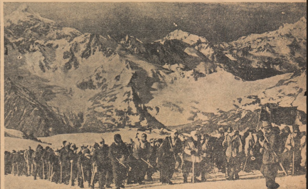
Ascensiune de mase pe muntele Elbrus. Imagine din expoziția „Sporturile de iarnă în U.R.S.S.”