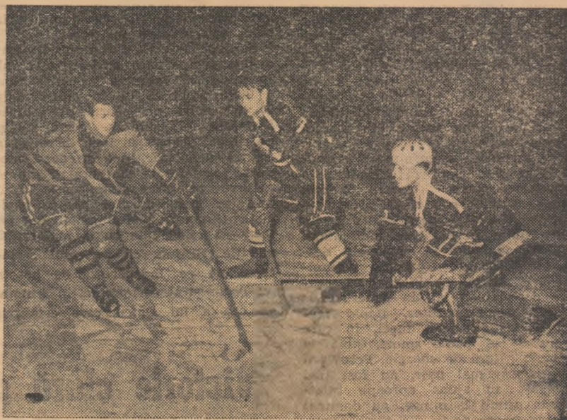
Fază din meciul Voința M. Ciuc — Atlatul Gheorghieni.

pre echipele participante și despre forma lor. Meciurile la care am asistat sâmbătă și duminică au sosit în evidență buna pregătire a formației Steaua, care a și câștigat primele partide la diferențe de scor categorice. Echipa militară are acum o primă linie de atac (Biro, Calamar, Geza Szabo) foarte puternică și, în plus, manifestă mai multă siguranță în apărare. O surpriză plăcută cele două... „Științe”. ceasta din urmă formație, care continuă să conducă în clasament, nu s-a părut la primele jocuri mai puțin viguroasă și mai puțin sigură în atac, și mai ales în apărare. În linii generale se poate spune însă că lupta pentru ocuparea primelor locuri se anunță pasionantă, întâlnirile decisive programate în aceste zile promițând spectacole de calitate. Și acum despre primele meciuri. Steaua — Steagul roșu 20-0 (7-0, 2-0).