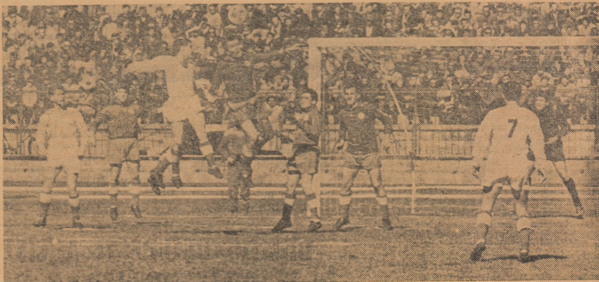
Atac al lui Dinamo București la poarta dinamoviștilor băcăoani: fundașul Gross respinge cu capul.