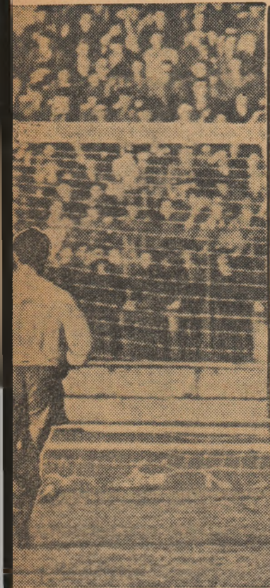
Seredai ratează o ocazie unică.