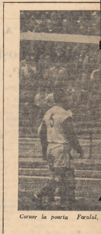
Corner la poarta Farului.