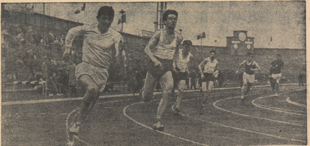
Start într-una din seriile cursei de 200 m.