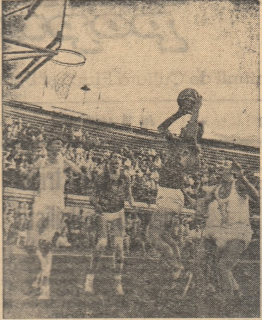
Fază dintr-unul din meciurile R. P. Romina-R. P. Polona disputate în țara noastră

Doar o săptămână ne mai desparte de începerea turneului internațional de baschet de la Cluj, la care vor participa selecționatele masculine ale R.P. Bulgaria, R.S. Cehoslovacie, R.P. Polone și R.P. Romine. Fără îndoială, acest turneu reprezintă un important eveniment pentru iubitorii baschetului din Cluj, care vor avea prilejul să urmărească evoluția unor echipe cu o frumoasă reputație. E suficient să amintim, de pildă, faptul că baschetbaliștii bulgari și cehoslovaci au cucerit cu regularitate medalii de argint și de bronz la campionatele europene și că la Jocurile Olimpice de la Roma echipa R.S. Cehoslovacie s-a clasat pe locul V, iar cea a R.P. Polone pe locul VII.