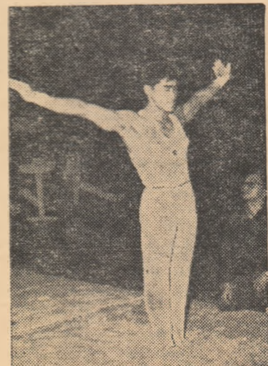
„Iată-l pe Endo evoluînd la sol, probă la care deține titlul de campion mondial.”

Interesul pe care iubitorii sportului din București îl manifestă pentru demonstrația de gimnastică de astăzi după-amiază din sala Floreasca este cu totul firesc. Gimnaștii japonezi se bucură de o binecunoscută și binemeritată reputație pe plan mondial și prezența lui Endo în capitala noastră constituie nu numai un punct de atracție deosebit, ci și un bun prilej de a urmări „pe viu” pe unul din cei mai mari gimnaști ai lumii. După două strălucite demonstrații la Iași, iată că delegația de gimnaste și gimnaști japonezi evoluează astăzi în București.