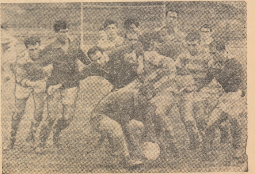
Steaua cîștigă balonul și va iniția o nouă acțiune pe linia de treisferturi.

Știința Petroșeni — Dinamo 3-11 (0-3); Rulmentul Btrlad—Unirea 15-3 (9-0); Știința Timișoara—CSMS Iași 0-3 (0-3); Gloria — Farul Constanța 13-0 (5-0).