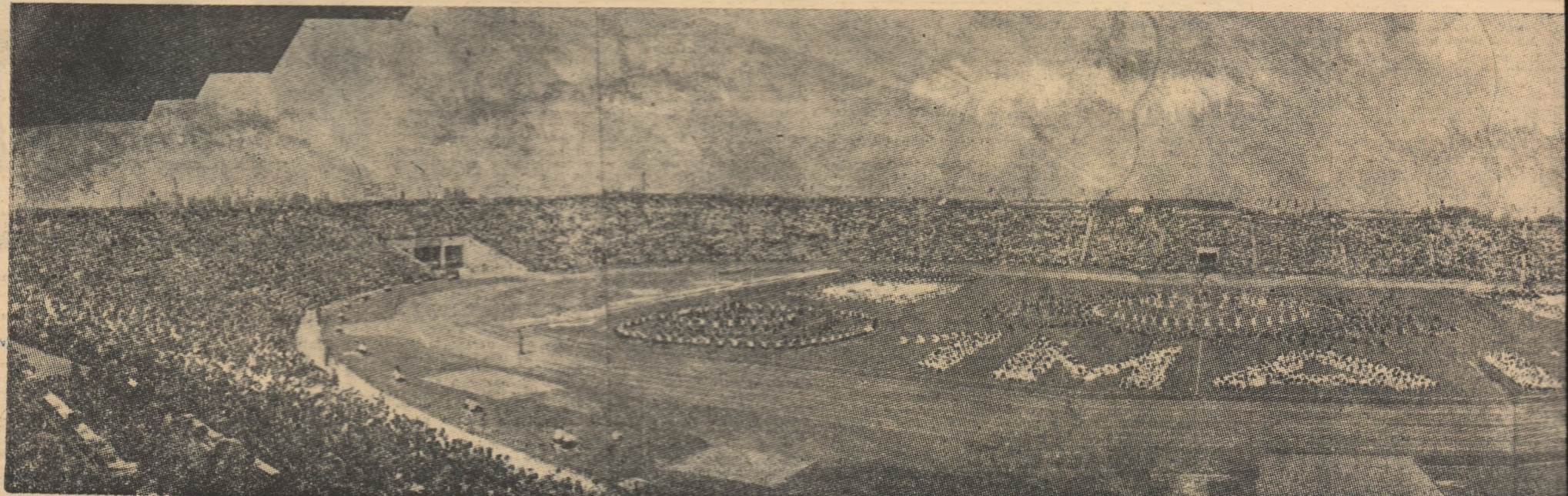
Vedere panoramică a marelui stadion „1 Mai” din Timișoara

a ținut cu orice preț să-și răpindă greșeala, inițiază o acțiune proprie, dribleză doi adversari și înscrie dintr-un unghi dificil, doilea gol al echipei maghiare marcat de Morvai din penaltu, urma unui fault comis de B.