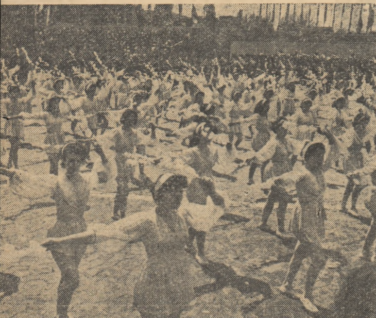
Valnic a irupt primăvara în această zi de sărbătoare... Florile ei immaculate împodobesc coloana tinerelor sportive, încântând privirile prin gingășie și prospețime