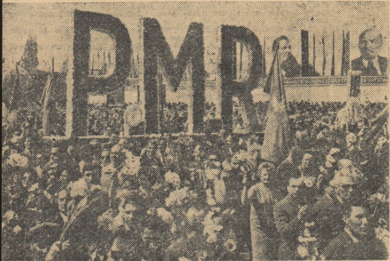
Te de mii de oameni ai muncii din Capitală defilează într-un flux nesfârșit în fața tribunelor, exprimându-și bucuria fără margini pentru viața lor nouă și fericită, făurită sub conducerea partidului iubit.