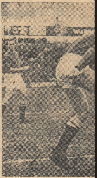
O fază din meciul București — pentru balon

În continuarea turneului, fotbalourii vor evolua duminică la Dozsa miercuri la Bekescsaba.