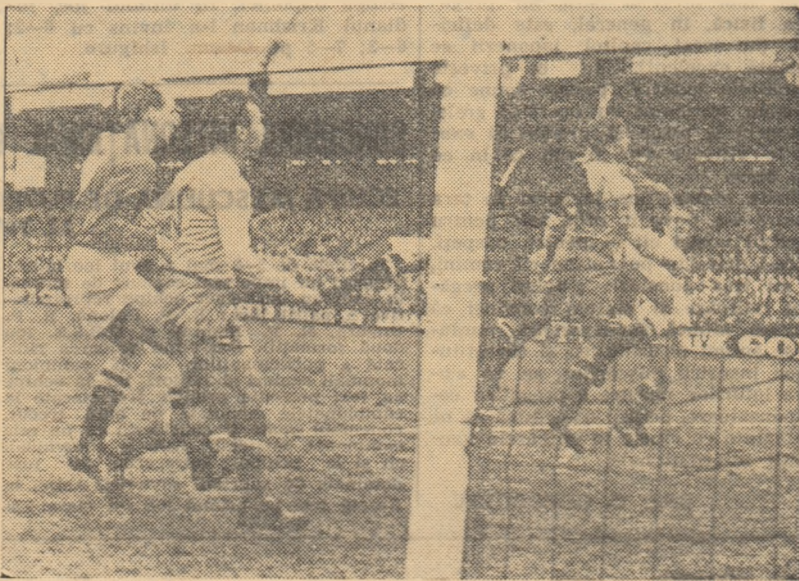
Un aspect din primul meci al turneului: București — Copenhaga 2-0.