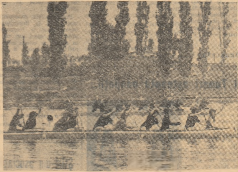
Canotaj popular. Aspect din proba de canoe 10 + 1 fete în care s-a urmărit, desigur, nu atât performanța cit... prietenia tinerelor studente cu sporturile nautice.

Peste 330 de studenți și studente s-au întâlnit duminică dimineața în probele primei ediții a campionatelor universitare de sporturi nautice. Au participat sportivi din numeroase institute (Politehnic, Universitatea, Pedagogic, Agronomic, Construcții, Medico-Farmaceutic și Petrol și Gaze).