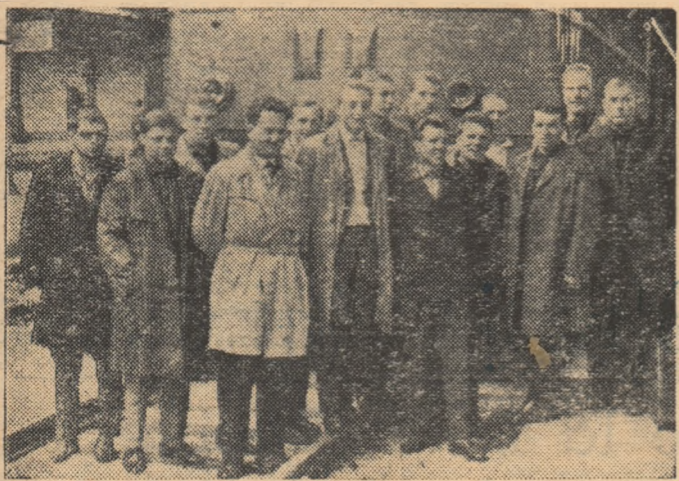
Poliștii de la Lokomotiv Karl Marx Stadt la sosirea în Gara de Nord.

Ieri la prînz a sosit în Capitală, la invitația clubului Rapid, echipa de polo Lokomotiv Karl Marx Stadt din R. D. Germană. Oaspeții noștri vor susține la București trei înfrîngeri în cadrul turneului la care mai participă selecționata de seniori și de juniori ale Capitalei, precum și formația clubului organizator, Rapid București.