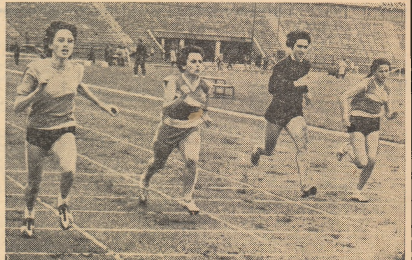
Fază din întrecerea junioarelor buchureștene pe 100 m.

BRAȘOV. Elevii și elevele de la S.M. au participat recent la un concurs pentru desemnarea celor care vor lua parte la