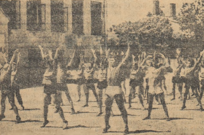
Program de pregătire fizică generală... Execută atleții de la Centrul școlar agricol din București