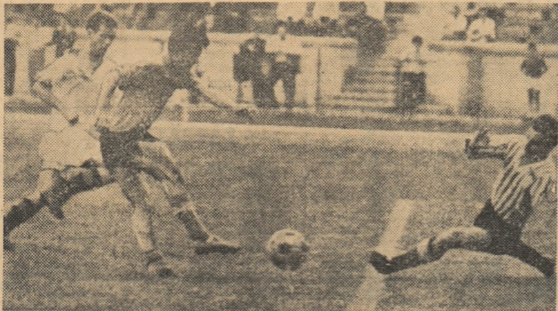
Portarul craiovean a ieșit la timp, închizând „unghiul” și lămurind astfel o situație dificilă. Fază din meciul Dinamo Oradea — Știința Craiova

Viitoare: C.F.R. Roșiori — Brașov, Unirea Rm. Vilcea — Buc., Progresul Alexandria — Reșița, Chimia Făgăraș — Oradea, Metalul București — Sibiu, Știința Craiova — Dinamo, Metalul Tr. Severin — Unirea Rm. Vilcea.