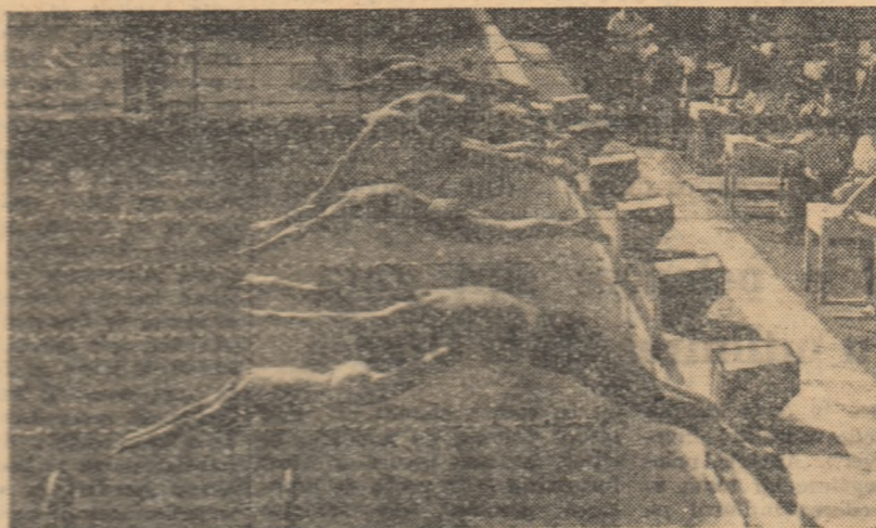
Start într-o probă de 400 m liber, rezervată juniorilor.

● Intercerile se vor desfășura după următoarea programă: BĂIEȚI - ziua I: 100 m liber, 200 m flutur, 200 m spate, 200 m bras, 400 m mixt, 400 m liber, 4x100 m mixt; ziua a II-a: 4x100 m liber, 1500 m liber, 100 m spate, 100 m bras, 100 m flutur, 4x200 m liber; FETE - ziua I: 100 m liber, 100 m spate, 200 m bras, 100 m flutur, 4x100 m liber; ziua a II-a: 100 m bras, 400 m liber, 100 m mixt, 4x100 m mixt.