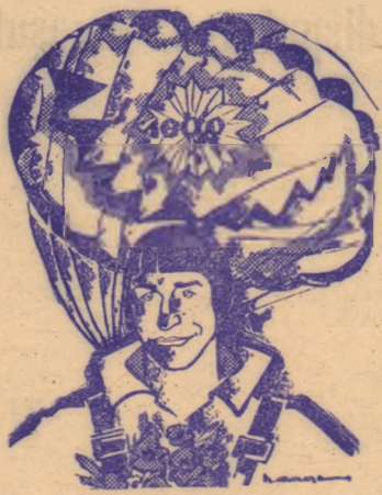
GHEORGHE IANCU Văzut de Neagu Radulescu