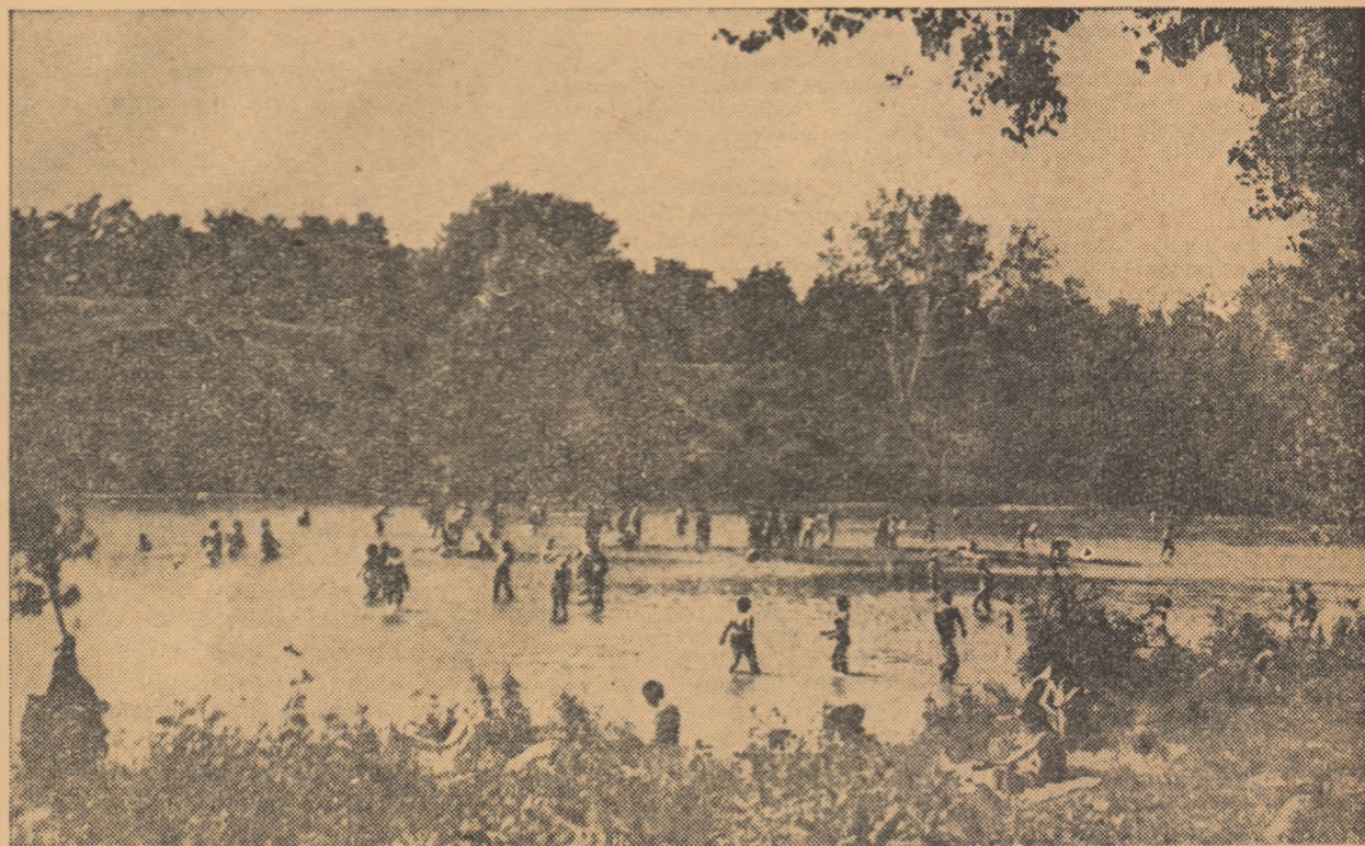
Ieri a fost o căldură toridă. Mii de bucureșteni au plecat dis-de-dimineață în excursii către pădurile și lacurile din jurul Capitalei. Unii au poposit la Pustnicul sau Băneasa, alții au mers la Argeș, unde s-au bucurat de o odihnă plăcută. În fotografie, un aspect de la Buda-Argeș.