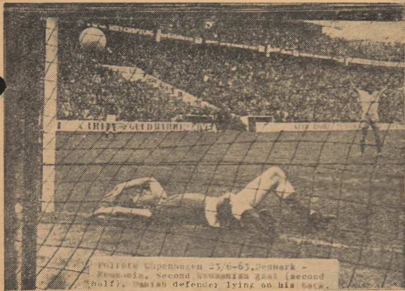
Polistea Copenhaga 23/6-63, Deuvark - Romania. Second hunarian goal (second half). Danish defender lying on his back.