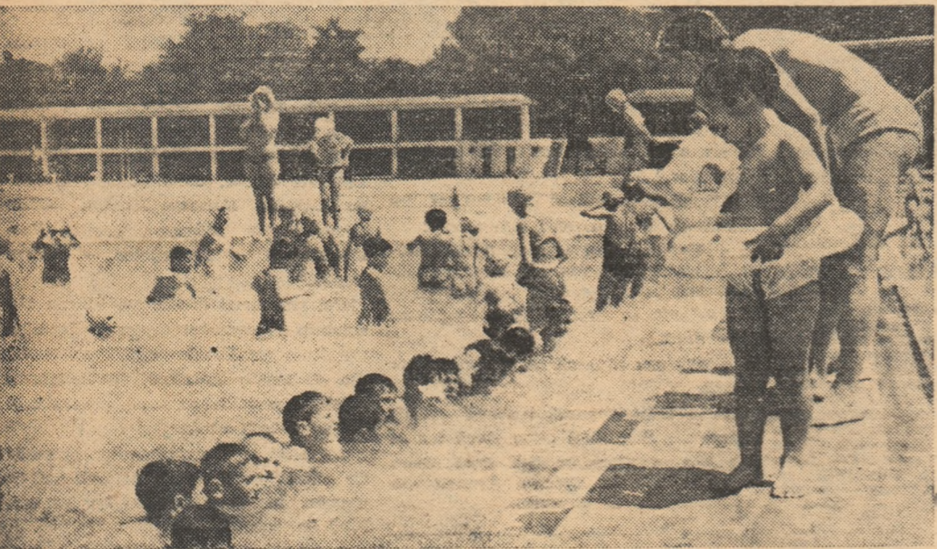
Și acum... la treabă