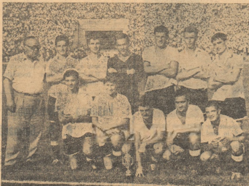
„II-lea” campion, imediat după meci

Spre sfârșit oaspeții se apără cu dirzenie și inițiază din cind cind contraatacuri periculoase. Fluierul final consfințește victoria meritată a echipei Farul Constanța, care devine, astfel, pentru a doua oară, consecu- tiv, campioană a țării.