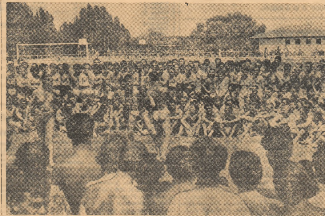
Aspect de la demonstrația de box organizată duminică la Complexul cultural-sportiv studențesc de la lacul Tei.

Calendarul internațional al meciurilor de fotbal romînă și italiană se va disputa în anul 1964 a mai sau iunie, la București.