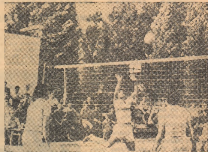
Voleiul a fost unul dintre sporturile cu start „aglomerat” în întrecerile Spartachiadei de vară a tineretului din raionul Lenin din Capitală. În fotografie, un aspect din zilele de meciuri de volei ce au avut loc pe terenul asociației sportive Vulcan.