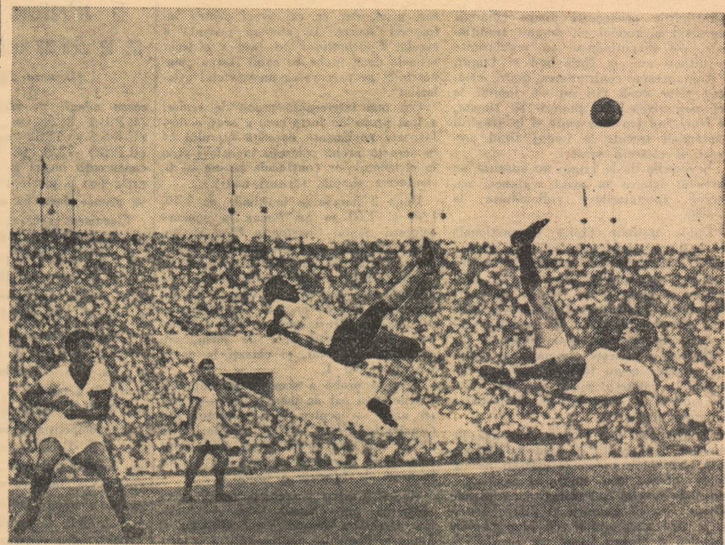
R. Onodi — București Simetrie...