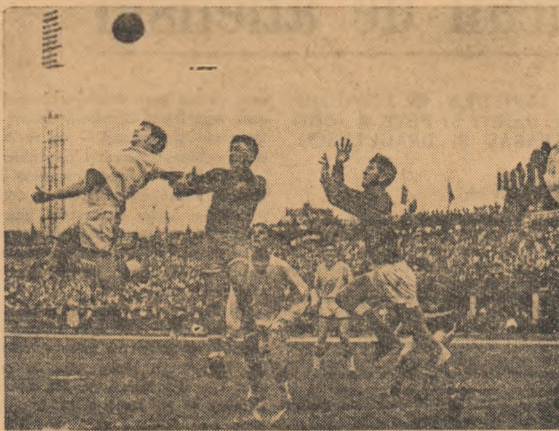
Fază din meciul de juniori dintre selecționatele A și B