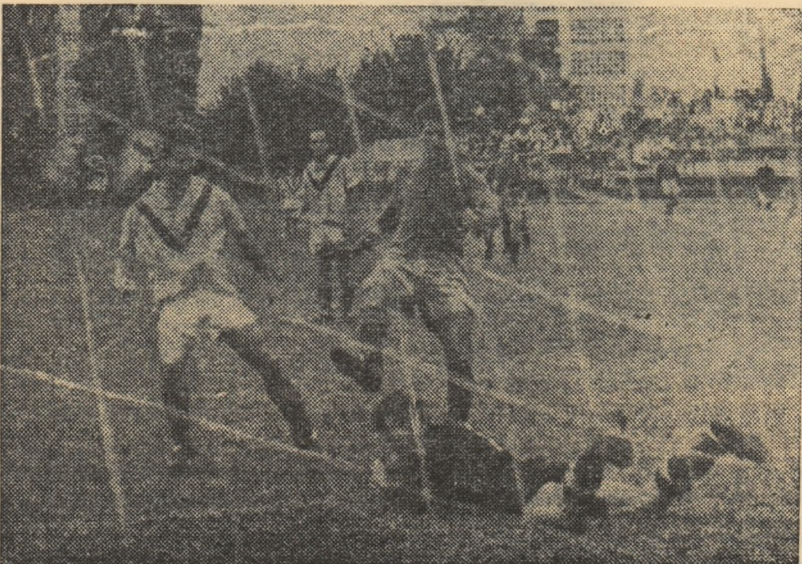
La un atac al Științei, Bogossy (Foresta), atent, reține balonul. (Fază din meciul Știința Buc. — Foresta Fălticeni 0-1).