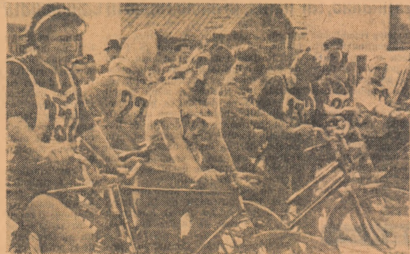
Sîmbătă și duminică la Birlad cei mai buni sportivi din satele și comunele regiunilor Bucaciu, Iași, Mureș-Autonomă-Maghiară și Suceava își vor disputa trinitatea în finala pe grupe de regiuni a Spartachiadei de vară. Printre probele finalei figurează și ciclismul. Fotografia noastră reprezintă pe ciclistele, regiunilor mai susamintite, cu câteva secunde înainte de startului la competiția similară de anul trecut, care s-a desfășurat în regiunea Suceava

Se apropie actul final al Spartachiadei de vară a tineretului, dotată la sate cu „Cupa Agriculturii”. După cum se știe, în mediul rural marea competiție a tineretului, Spartachiada de vară, ia sfîrșit cu întreceri finale organizate pe grupe de regiuni.