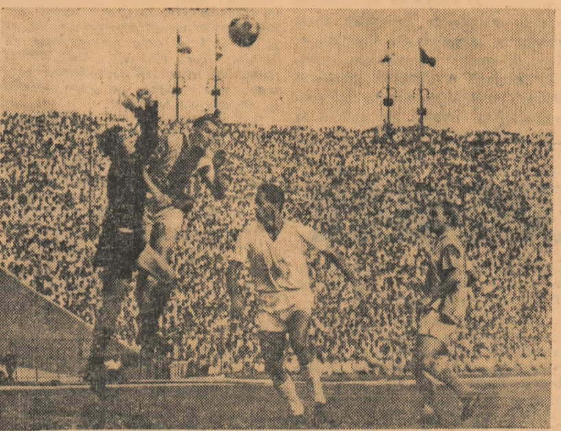
Datu și Oaidă au sărit în același timp la balon. Ivan și Mateianu așteaptă rezultatul acestui „duel”. (Fază din meciul Progresul-Dinamo București)

● 3 noiembrie: returul partidei R.P. Romîni - Danemarca din cadrul preliminarilor olimpice (București).