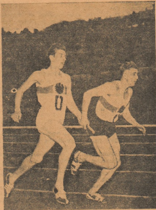
Kaufmann predă ștafeta colegului său Fütterer la Campionatele internaționale din 1955

● Federația norvegiană de atletism a făcut cunoscute numele sportivilor care vor participa la C. I.: Kjellfred Weum (110 mg), Odd Fuglem (5000 m), Kjeel Hovik (prăjină), Odd Bergh (triplu), Gunnar Artzen (suliță), Sterre Strandli (ciocan), Berit Toyen (lungime fete). ● Forul athletic de specialitate din Franța a comunicat înscrierile atletilor francezi care vor participa la București: Lagorge (100 m-10,5), Berger (100 m-10,6), Senpere (400 m-47,0), Chatelet (800 m-1:48,9), Teze-reau (3000 m obst.-8:46,6), Chardel (110 mg-13,9), Moreau (prăjină -4,60), Husson (ciocan -67,73).