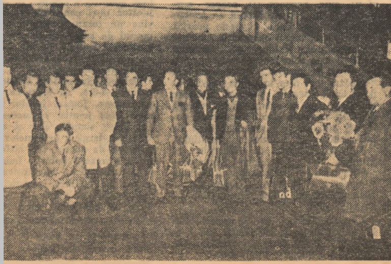
Echipa Real Madrid, la sosire pe aeroportul Băneasa