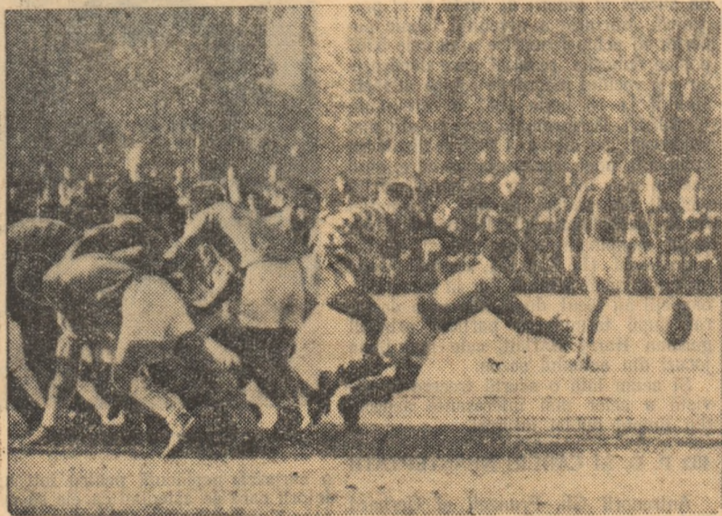
Fază din jocul Combinata Steaua-Dinamo și Grivița Roșie-Progresul

● COMBINATA STEAUA-DINAMO — COMBINATA GRIVIȚA ROȘIE-PROGRESUL 14-0 (3-0) ● CLUBUL SPORTIV ȘCOLAR BUCUREȘTI — A.S. TECUCI 31-0 (20-0)