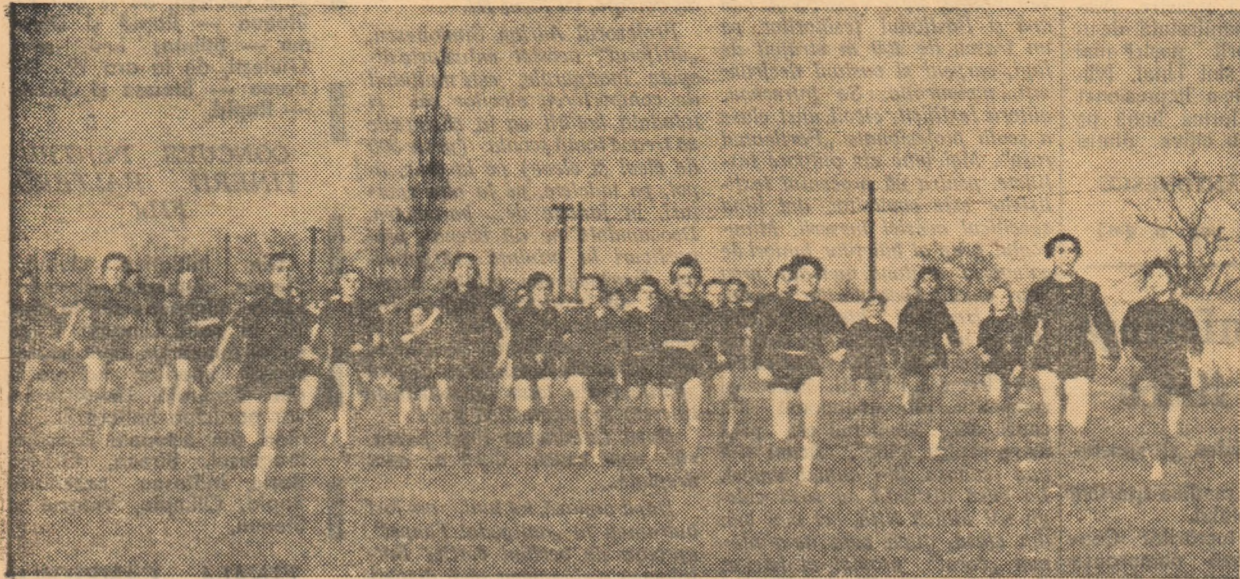
Aspect de la unul din crosurile desfășurate în Capitală cu ocazia deschiderii „Spartachiadei de iarnă a tineretului”.