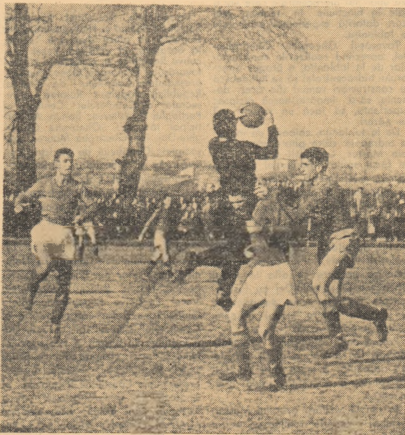
Fază din meciul Știința București — Tractorul Brașov disputat duminică în Capitală.

ARIEȘUL TURDA — C.S.M. SIBIU 2-0 (1-0). Loc de mare luptă dar