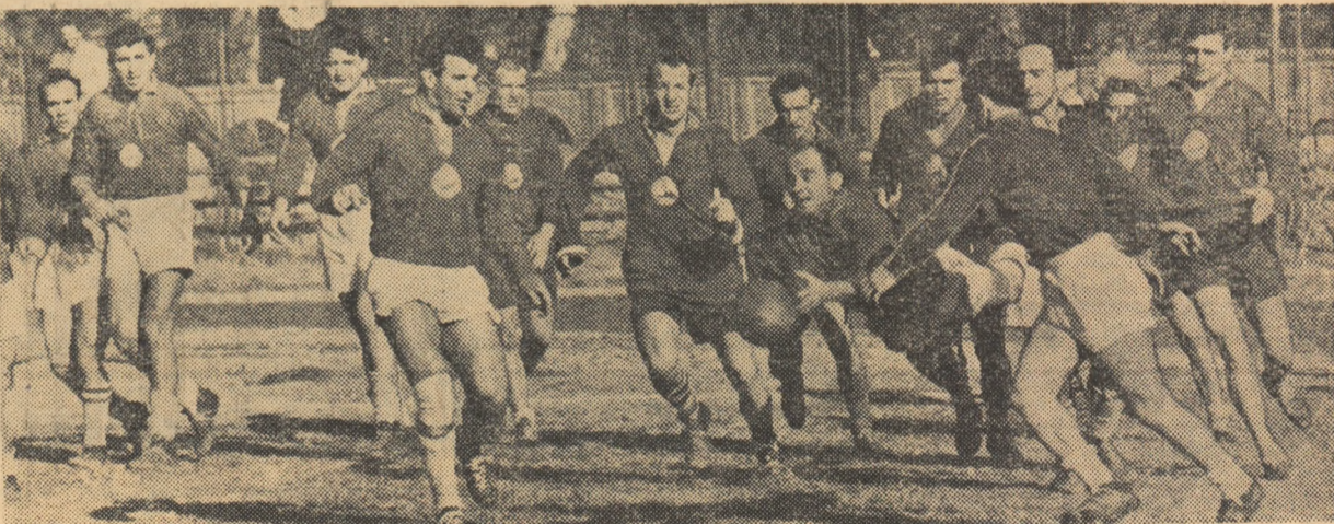
Fază din jocul: Lotul R.P.R. — combinata Steaua—Dinamo

• JOC FRUMOS ÎN „DESCHIDERE” LA PROGRESUL • LOTUL REPUBLICAN A REEDITAT SCORUL DE MIERCURI • CSS BUCUREȘTI — ȘTIINȚA TIMIȘOARA 9-0 (6-0) ÎN FINALA CAMPIONATULUI DE JUNIORI • ANCORA GALATI A MAI TRECUT UN OBSTACOL