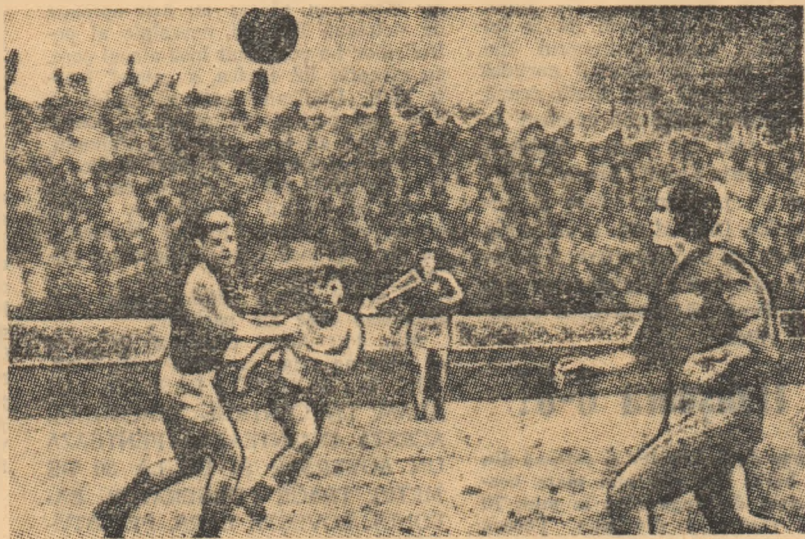
Așa a marcat Sasu golul victoriei: România — Danemarca: 2-1

și tehnicienii al federației italiene de fotbal și alții. Ei au vizionat o partidă de calitate, de un rar dramatism, care a impresionat în mod cu totul plăcut”. Iată de ce considerăm că la cele subliniate de ziarele locale și centrale din Italia ca la rubrica „5 minute după meci” este interesant să mai oferim cititorilor alte declarații luate de la o serie de personalități, specialiști și spectatori, declarații care oglindesc excelenta comportare a sportivilor romini, puterea lor de luptă în partida decisivă de la Torino desfășurată joi 28 noiembrie.