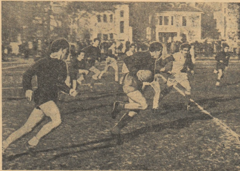
Aspect de la jocul Știința Timișoara — Precizia Săcele, câștigat de timișorenii

Lipsită de aporțul unui mare număr de titulari (regulamentul interzice folosirea jucătorilor legitimați după 31 august), timișorenii — care din acest motiv nu porneau favoriți — au cucerit totuși o meritată victorie, după o partidă în care au acționat mai clar decât adversarii lor, au avut superioritate în jocul la tușă și, în general, au dominat mai mult. Ei au deschis scorul prin Naca (lovitură de pedeapsă), dar Precizia a egalat în ultimele secunde de joc prin Luca (lovitură de pedeapsă). După pauză, „supărați” că nu pot... înscrie, rugbiștii din Săcele dau semne de nervozitate. Profită timișorenii care înscriu prin Naca (lovitură de pedeapsă): 6-3. Partida a fost de nivel tehnic mediocru. Spectatorii au aplaudat, în schimb dirzenia celor două echipe și victoria Științei Timișoara, care va continua astfel să joace în primul campionat al țării. Puțini au fost acei care credeau că echipa Farul va părăsi terenul invinsă. Și, totuși, așa s-a întâmplat. Con-