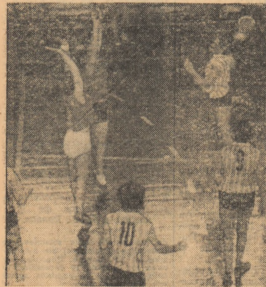
„Cupa Sportul popular” este în plină desfăşurare în Bucureşti. În fotografie, o imagine din partida feminină dintre echipele C.S.S. şi Rapid, încheiată cu scorul de 8—6 în favoarea primei.

SIBIU. — Întrecerile de handbal în 7 din cadrul „Cupei F.R.H.” şi „Cupei SPORTUL POPULAR” se desfăşoară cu multă regularitate. Iată ultimele rezultate: Masculin: Înainte Sibiu — S.S.E. Sibiu 18—18 (10-7); Arbitrii—Constructorul 21—21 (9-8); Voinţa Sighişoara—„9 Mai” Cislădieoara 28—16 (13-11); Metalul Coşca Mică—Voinţa II-Sibiu 15—14 (10-8); A.S.A. Sibiu—Steagul roşu Mediaş 13—21 (8-14).