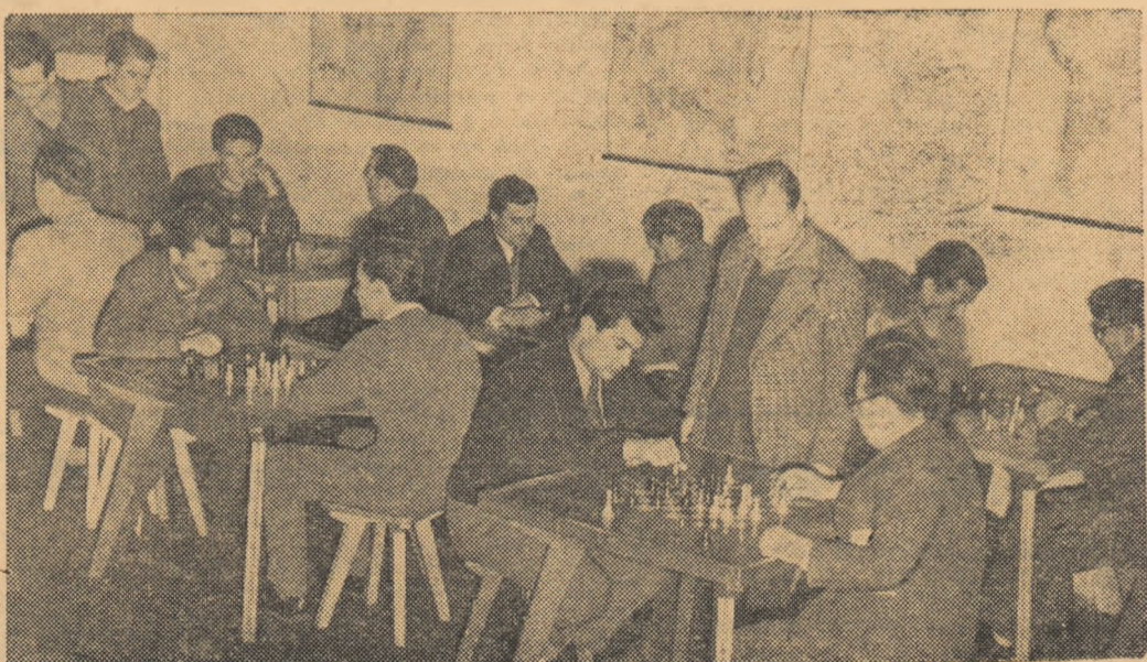
În plin concurs de șah. La asociația sportivă I.T.B. Linăriei au loc întreceri în cadrul Spartachiadei de iarnă a tineretului.