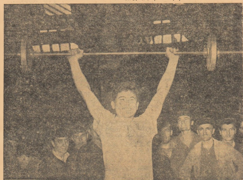
Concurentul care ridică haltera este urmărit cu atenție de colegii săi de muncă și concurs.