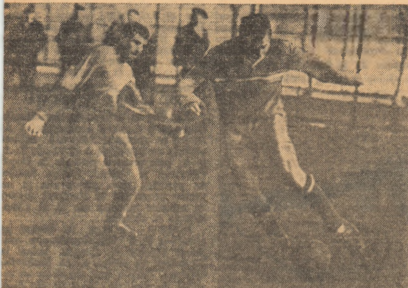
Aspect din meciul de ieri.

cuții (pase, preluări, șuturi la poartă) remarcate în jocul lor s-au datorat în mare parte terenului care a îngreunat controlul balonului. Din punct de vedere tactic: așezare și mișcare în teren, încadrată în sistemul 1-4-2-4; fundașii centrali concurează bine între ei, cât și cu cei doi mijlocași, asigurați