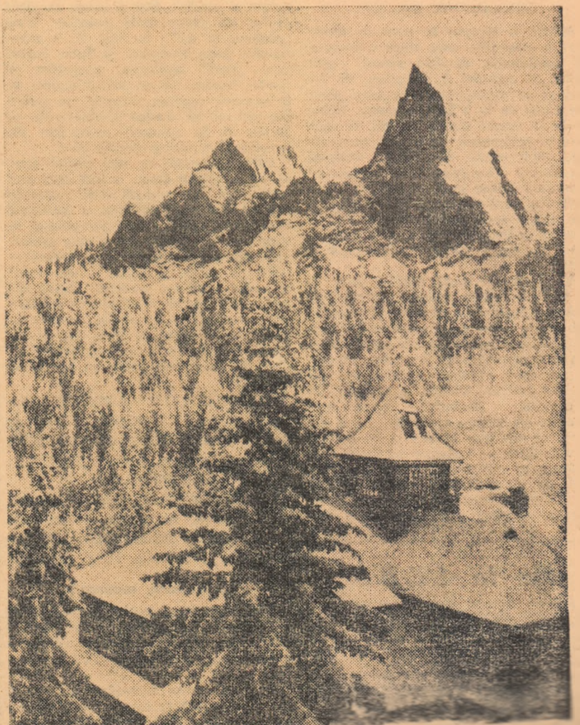
Muntele Rarău cu virful „Pietrele Doamnei”