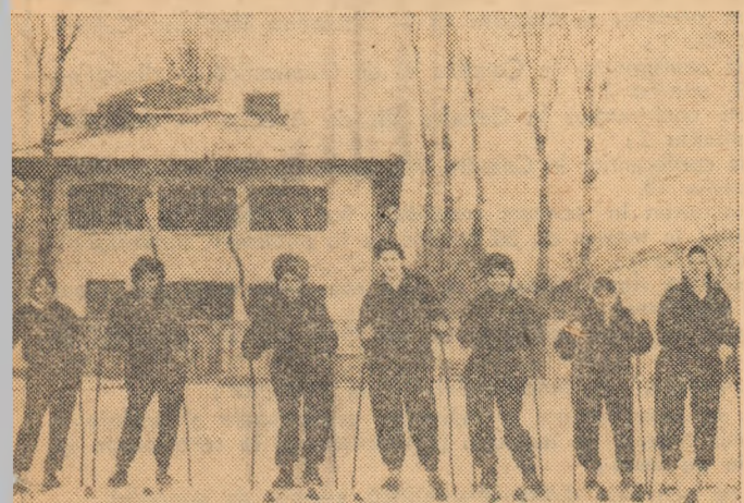
Fetele filatoare de la F.R.B. în așteptarea startului primului concurs de fond al sezonului

Pe la ora 16, la baza sportivă Filaturii Romîne de Bumbac, adunaseră aproape o sută de tineri și tinere, pentru a se întrece în cadrul Spartachiadei de iarnă a tineretului la schi. După ce au fost împărțite în echipe și au primit instrucțiuni de la antrenori, au început să se întrecă. Au început întrecerile la schi. La ele au participat în această zi numai fetele. În zilele ur-