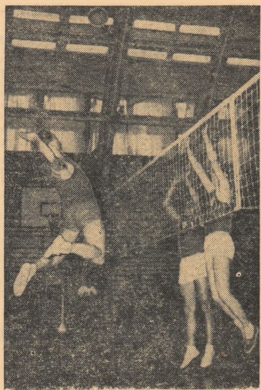
O spectaculoasă acțiune la fileu în meciul Steaua-Tractorul Brașov, încheiat cu victoria oaspeților cu 3-1

Iată rezultatele obținute în etapa de duminică, în cadrul seriei a II-a: MASCULIN: Olimpia București — Dinamo Suceava 3-1 (15-8, 9-15, 15-5, 15-8). Prezentîndu-se mult mai bine la capitolul pregătire și voință de luptă — datorită în mare măsură promovării multor elemente tinere în formație — Olimpia București a cîștigat pe merit acest meci. Dinamo Suceava a acționat curajos și a arătat calități frumoase. Dr. Căldare este animatorul echipei, luînd parte la toate acțiunile