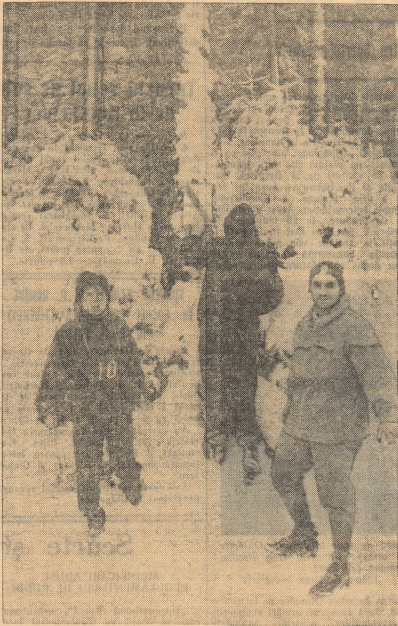
Și iarna concursurile de orientare turistică sînt foarte atractive. În fotografie: echipa Flacăra, cîștigătoare ediției de anul trecut a „Cupei cinematografiștilor”.

În timpul scurt care a mai rămas până la începerea campionatului, comisiile de turism și alpinism din asociațiile sportive trebuie să ceară afilierea la Comisia Centrală de Turism și Alpinism și totodată să-și intensifice munca pentru formarea cadrelor tehnice (arbitri) care să conducă concursurile, să-și pregătească busolele, hărțile, schișele etc. De asemenea, să se intensifice pregătirea fizică a sportivilor (în săli și în aer liber), să se organizeze cu regularitate ieșiri ale acestora pe munte, în condiții atmosferice diferite, să se insiste asupra realizării deprinderii de a se orienta cu ușurință și în timp cât mai scurt cu ajutorul hărții și busolei. Pentru a se asigura o largă participare la concursurile de orientare turistică, comisiile asociațiilor sportive au datoria să organizeze