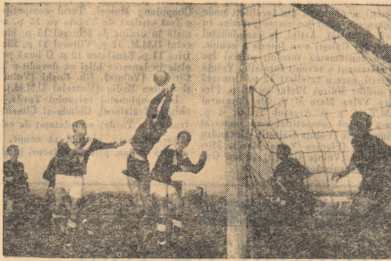
Minerul Deva a atacat cu multă vigoare în partida cu Teba Arad, așa cum se poate vedea și din această fotografie

● Cel mai viguros atac: Vagonul ad — 29 de goluri marcate; liniile atac cele mai lipsite de eficacitate: