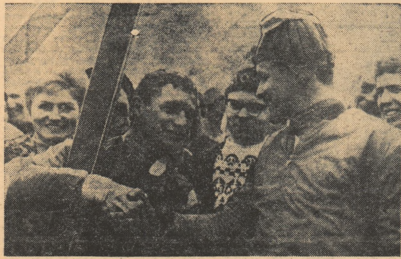
Doi schiori renumiți care vor avea un cuvînt de spus la Jocurile Olimpice de iarnă (la coborîre, slalom special și uriaș): francezul Guy Perillat (stînga) și Egon Zimmermann (Austria)