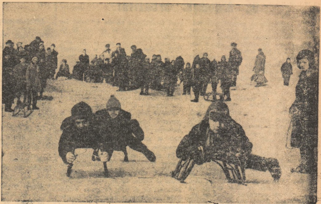
În raionul Tudor Vladimirescu pe... pîrțile din Balta Albă un interesant concurs de schi

Sprijiniți cu priceperea și experiența voastră organizarea și desfășurarea în asociațiile sportive a întrecerilor Spartachiadei de iarnă a tineretului!