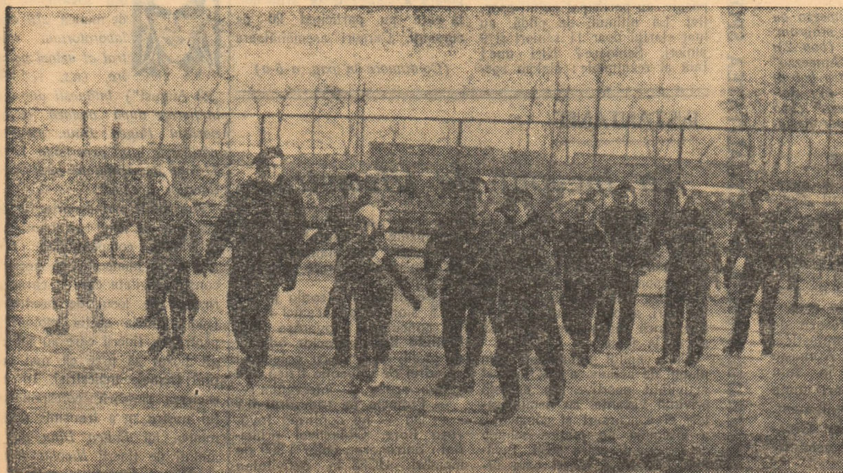
Un grup de concurenți, la... încălzire înainte de întreceri!

Stadionul Voința găzduiește zilnic concursuri de patinaj și schi. Cele 100 de perechi de schiuri și cele 50 de patine din magazinele bazei sportive stau la dispoziția membrilor UCFS din asociațiile Voința.