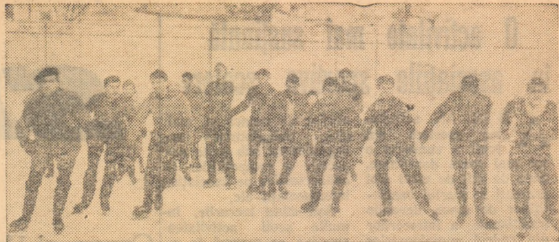
Patinoarul amenajat pe unul din terenurile de tenis din Parcul sportiv Progresul din Capitală a devenit în aceste zile geroase un loc deosebit de frecventat de iubitorii patinajului. Pe lângă patinatori, începători și avansați, care petrec ore plăcute atunecnd pe lincul gheții, vin aici și o serie de membri ai asociațiilor sportive din raionul Lenin, aparținînd de clubul sportiv Progresul, care se întrec „oficial” în cadrul Spartachiadei de iarnă. În fotografie, un grup de patinatori, elevi ai școlii medii nr. 22, antrenîndu-se pentru întrecerile Spartachiadei.

SPARTACHEIADA DE IARNĂ SE ORGANIZEAZĂ LA URMĂTOARELE SPORTURI: schi (coborîre, slalom sau fond), gimnastică, patinaj, trîntă, haltere, săniuș, tenis de masă, șah, cros, tir și orientare turistică.