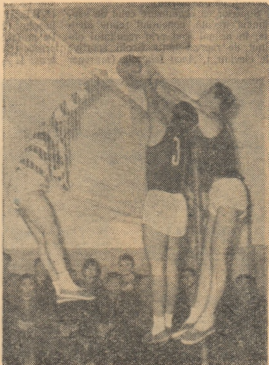
Ieri la Giulești. Atac ieșean stopat cu precizie de blocajul rapidist.

RAPID BUCUREȘTI — ȘTIINȚA BUCUREȘTI 3-1 (14-16, 15-11, 15-11, 15-13). — O dispută echilibrată — așa cum arată și scorurile seturilor, pe care, cu ceva mai multă atenție din parte-i, echipa Rapid o putea încheia cu 3-0 în favoarea sa. Nu-i mai puțin adevărat însă, că și studentele (care au condus, de exemplu, în setul ultim cu 10-4) puteau termina întrecerea cel puțin cu un re-