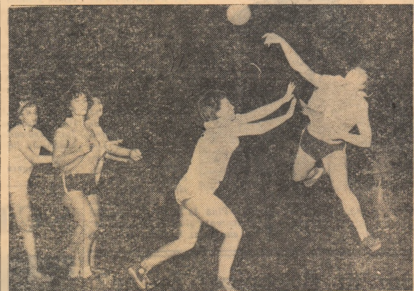
Luni, echipa Confecția a reușit un joc bun și a obținut o victorie clară asupra formației Progresul, cu 10—4. În fotografie o fază din această partidă: în atac, jucătoarele Confecției

CLUJ. — Învingînd în finală pe Știința Babeș-Bolyai cu 29—14 (15—8), C.S.S. (antrenor E. Fehervari) a ocupat primul loc la juniori, cîștigînd astfel dreptul de a reprezenta orașul în faza interregională. La junioare, meciul decisiv s-a disputat între Știința (antrenor T. Rusu) și S.S.E. (antrenor M. Pivaru), terminîndu-se la egalitate: 8—8 (3—4). Avînd un golaveraj mai bun, Știința a ocupat primul loc. (P. Radvani-coresp.).