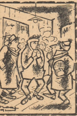
Care are curajul să se dezbrace primul?

Fotbaliștii de la Foresta Fălticeni, echipă care activează în campionatul categoriei B, trebuia să înceapă antrenamentele în ziua de 8 ianuarie. Trebuia... Ei au fost însă nevoiți să le mai amine cu citeva zile dintr-un motiv: conducerea asociației sportive nu luse în stare să le pună la dispoziție o... sobiță pentru încălzirea cabinei. O simplă scăpare în vedere?