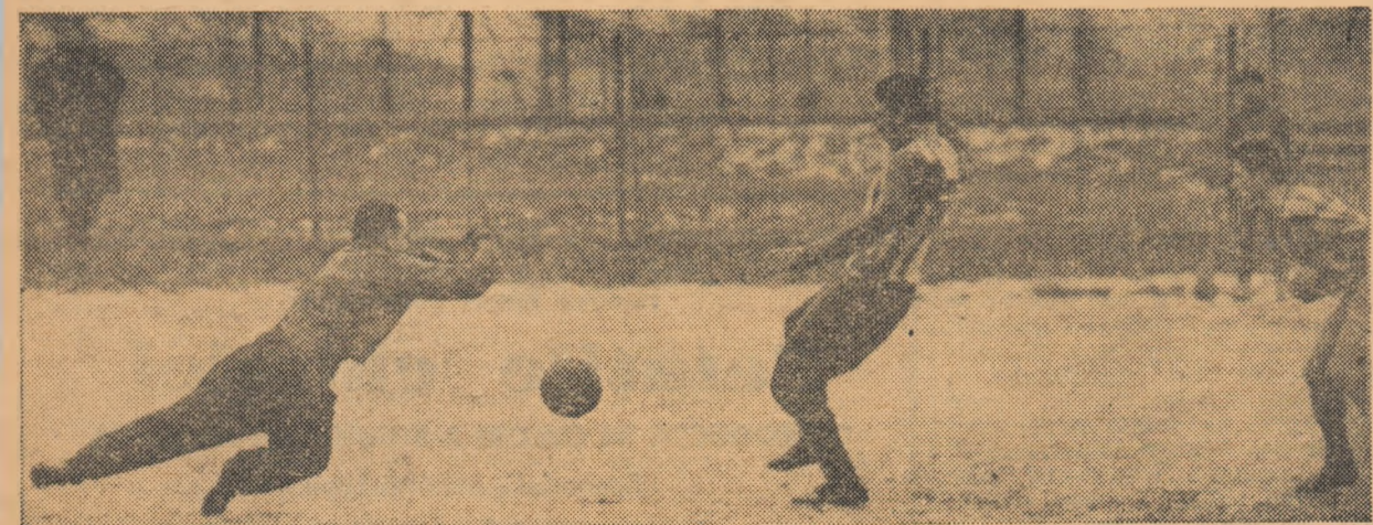
O fază din meciul de antrenament disputat ieri pe terenul Progresul din str. dr. Staicovici dintre echipele Progresul și Spic de grâu.