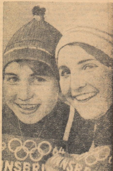
Surorile Goitschel zîmbesc fericite. Au și motive: două medalii de aur, două de argint!