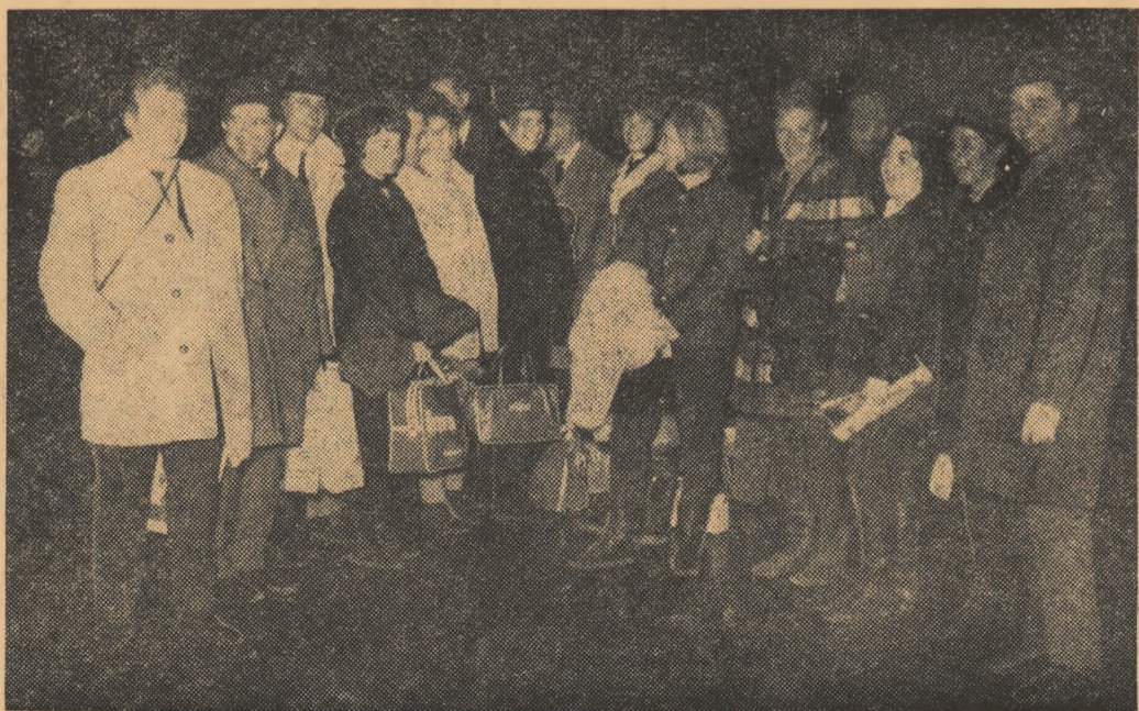
Tradiționala fotografie la sosirea pe aeroport.

HOCHEI. Patinoarul „23 August”, ora 17: Unirea București — Știința Sighișoara; ora 19: Steaua București — Metalul Rădăuți (turneul final al campionatului republican de juniori).