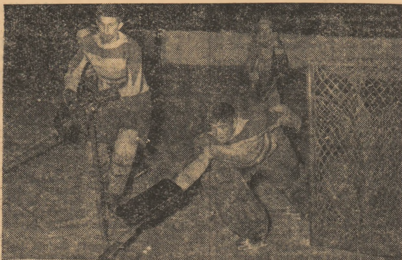
Un atac al echipei de juniori Unirea la poarta jucătorilor din Rădăuți