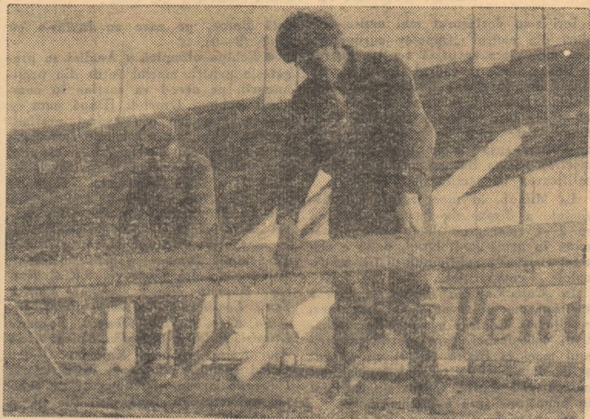
Timplarii montează noile porți de fotbal.

și la Timișoara meciul Electromotor—C.S.M.S. Iași a fost așteptat cu interes. Dar, numai de spectatori. Pentru că, echipa organizatoare „Electromotor”, ca și tova-