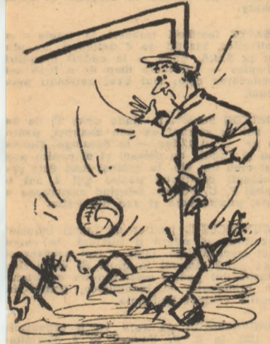
— Ajutor! Ni se îneacă fundașul! Desen de Neagu Radulescu