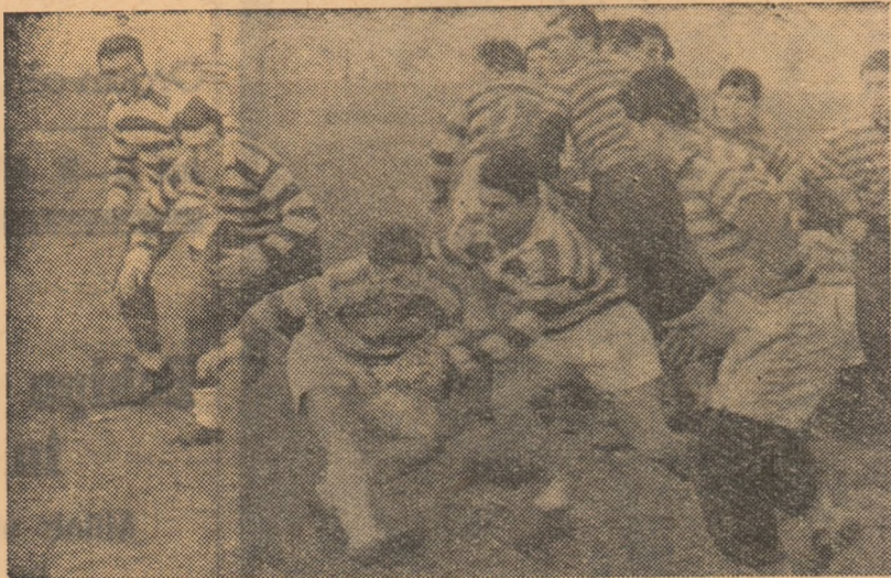
Unul din pușinele atacuri ale rugbiștilor de la Rapid este stăvilit de apărătorii echipei Unirea (fază din meciul Unirea — Rapid din cadrul „Cupei 6 Martie”).

Gloria—mai activă—a dispus de Progresul cu 9-3 (3-0)