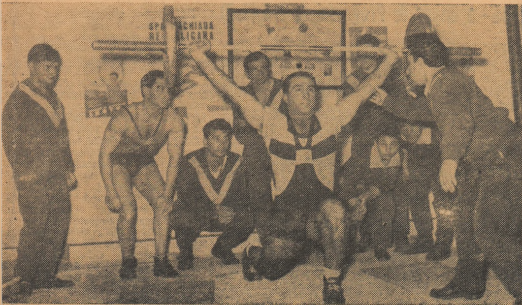
Pregătiri la Ploiești pentru viitoarele concursuri de haltere din cadrul Spartachiadei republicane. În fotografie, un aspect obișnuit din sala de haltere de pe stadionul Petrolul. Viitorii practicanți ai sportului celor puternici asistând la o lecție model. Se demonstrează stilul „smuls”