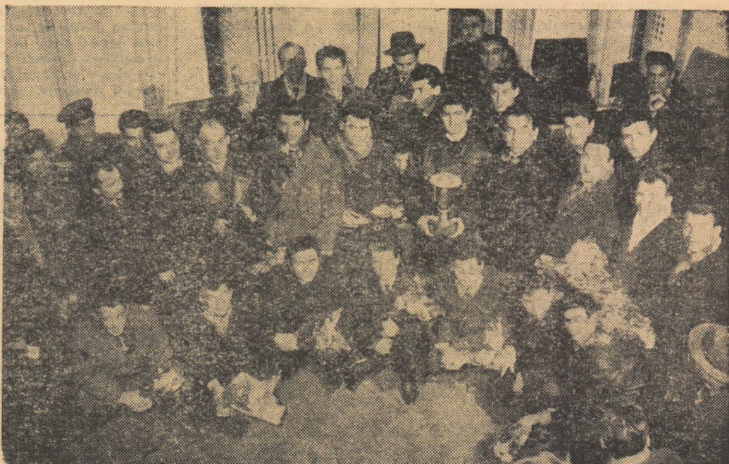
Campionii mondiali după sosire, la aeroportul Băneasa.